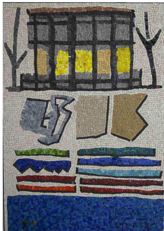
Sans titre, 99x71cm, Riccardo Licata, 2010