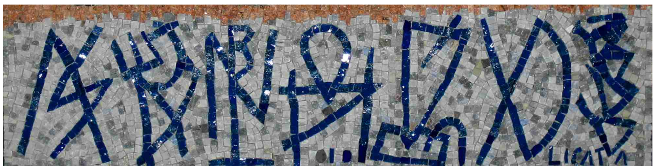
Sans titre (détail), Riccardo Licata, 2010